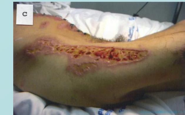
Fiebre inicial desbridada de la etapa IV