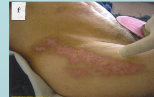
Cicatrización sin heridas después de 4 semanas